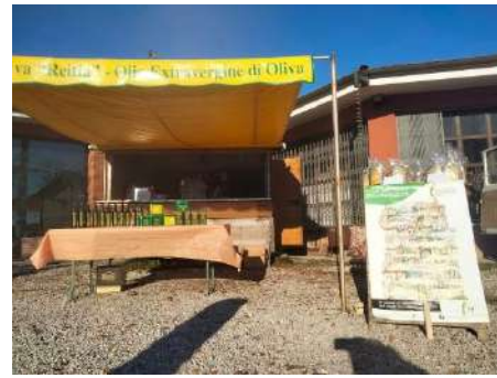
Mercato Locale «La Mattarella», Cappella Maggiore