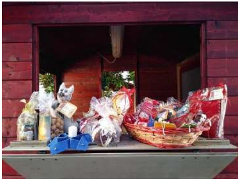
Mercatino di Natale, San Pietro di Feletto