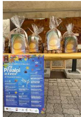
Prealpi in Festa, Cordignano