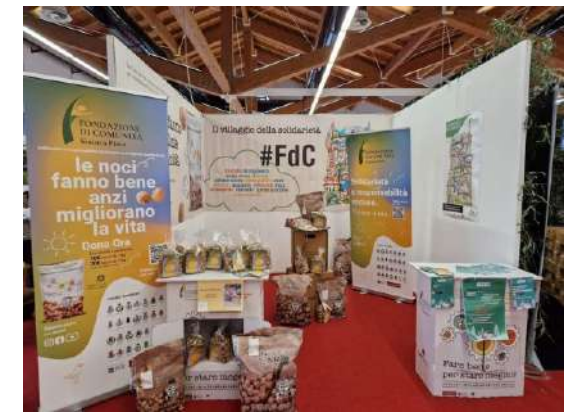
Fiera di Santa Lucia di Piave