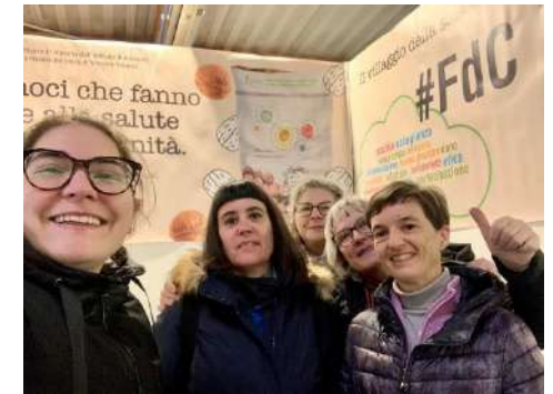
Antica Fiera di Godega