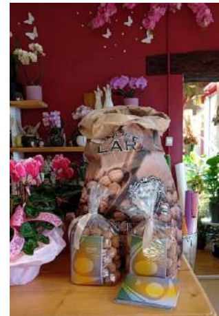
Punti distribuzione, Orsago